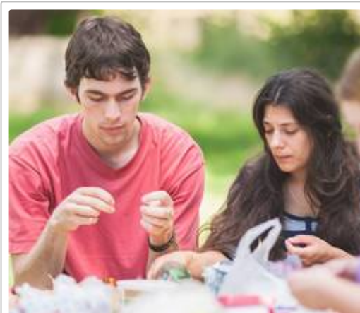
Navlékáme korálky. Jak symbolické...