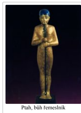
Ptah, bůh řemeslník

Amun byl tedy nahlížen jako zdroj Atuma. Je to Amunovo tělo, v němž je „sloučena Enneada“ a je to Amun, který „coby Atum kýchl z úst a zrodil Shu a Tefnut“. Egyptská synkretická „trojice“ je zde završena Ptahem. Ten byl během Střední říše znám jako docela obyčejný patron řemeslníků a do čela panteonu byl vyneset během Nové říše 27 . Jeho povýšení je docela logické. Jde o podobný myšlenkový pohyb, jako když při apologetické diskusi křesťané říkají, že za hmotným světem a za přírodními zákony existuje cosi jako tvůrčí princip, prvotní tvůrčí idea, bez níž by opravdu nebylo něco, nýbrž bylo by nic. Pídíme se tím po jakémisi intelektuálním pozadí hmotného světa a jeho zákonitostí. Toto intelektuální pozadí poskytl egyptřanům Ptah, který byl jako bůh řemeslník k přenášení samotných myšlenek do beztvare materií nejlépe kvalifikován. V Bibli tento koncept nalezneme v Janově evangeliu, když čteme, že „na počátku bylo Slovo“ 28 .