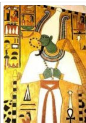
Osiris, potomek Geba a Nut, původně vládce Egypta, ale nyní vládce Duatu. Má zelenou barvu, protože je ručitelem životodárného nilského toku, o jehož vyvěráni z podsvětí se neustále zasluhuje.

(1) Propastná tůň a nebeská klenba (Gn 1,2.6). Nejspíše není třeba obsáhle vysvětlovat paralelu se stavem před stvořením a s druhým dnem stvoření, která se zde nabízí. V Genesis 1,2 byla země (Atumův pahorek) pustá a prázdná a nad propastnou tůň (Nun) byla tma. Bůh pak pomocí klenby stvořené druhého dne učinil v propastné tůni bublinu, takže náhle bylo možno hovořit o vodách nad a vodách pod klenbou.