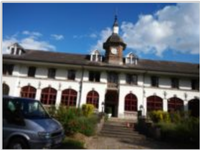
Průčelí budovy CTS