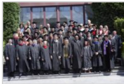
Absolventi, učitelé, zaměstnanci