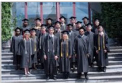
Letošní absolventi (bakaláři + magistři)