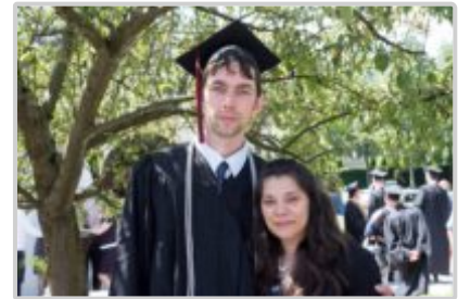
Já a Anička