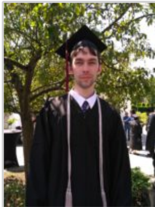
Me, myself, and I