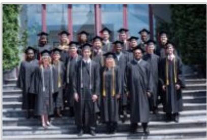
Letošní absolventi (bakaláři + magistři)