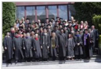
Absolventi, učitelé, zaměstnanci