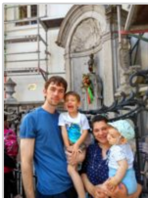
Na výletě u Manneken Pis