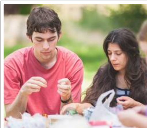
Navlékáme korálky. Jak symbolické...